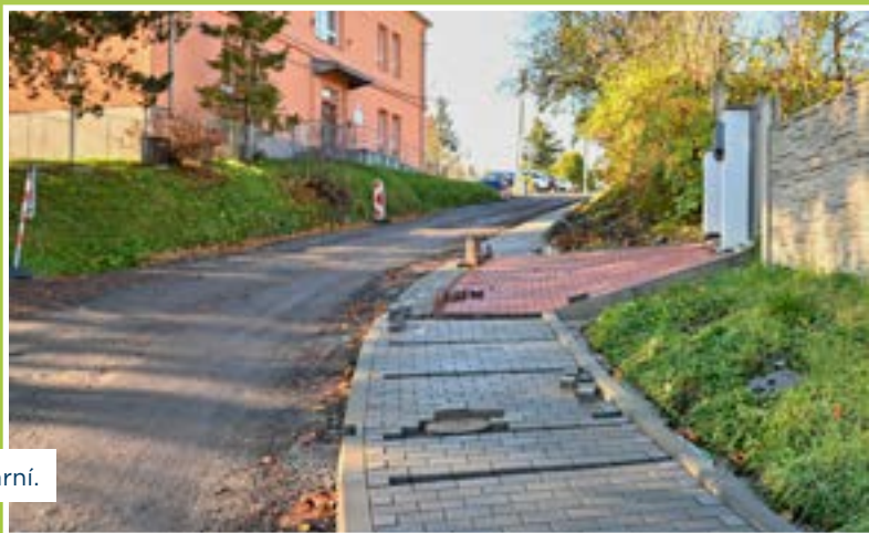
Výstavba chodníku na ulici Požární.

Zjednosměrněním ulic Zámostní a v oblasti Františkov se podařilo navýšit počet parkovacích stání v oblasti Na Františkově. Ukončením regenerace sídliště Kamenec (oblast „u eskadry“) rovněž vzniknou další parkovací místa.