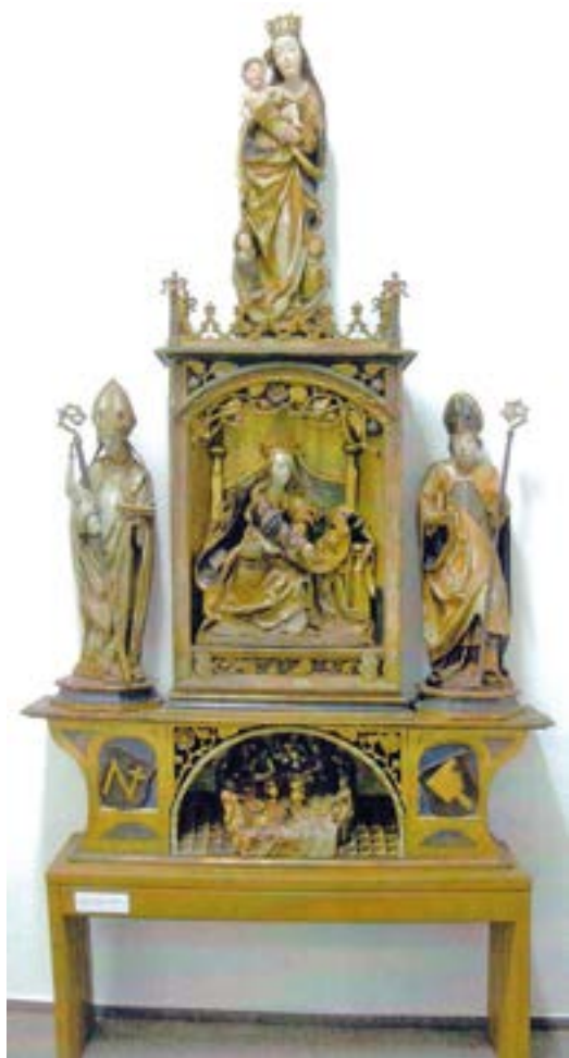
Oltář sv. Alžběty Durynské z 15. století

Všechny tyto umělecké artefakty, pocházející z kostela sv. Maří Magdaleny v Hrušově, jsou dalším dokladem starobylosti historie Slezské Ostravy.