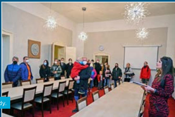
V zasedací místnosti rady.

Ve čtvrtek 16. prosince se od 10 hodin koná v KD Muglinov (Na Druhém 4) zasedání zastupitelstva městského obvodu. Živý přenos můžete sledovat na facebooku Slezská Ostrava.