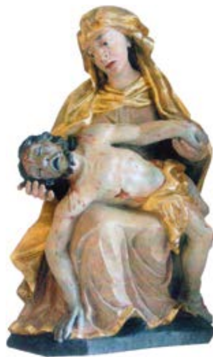
Pieta z 18. století