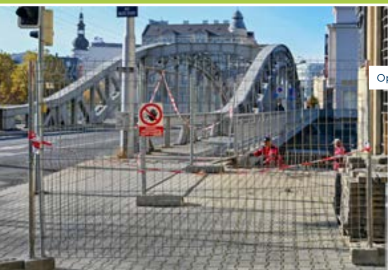
Oprava chodníku u mostu M. Sýkory.