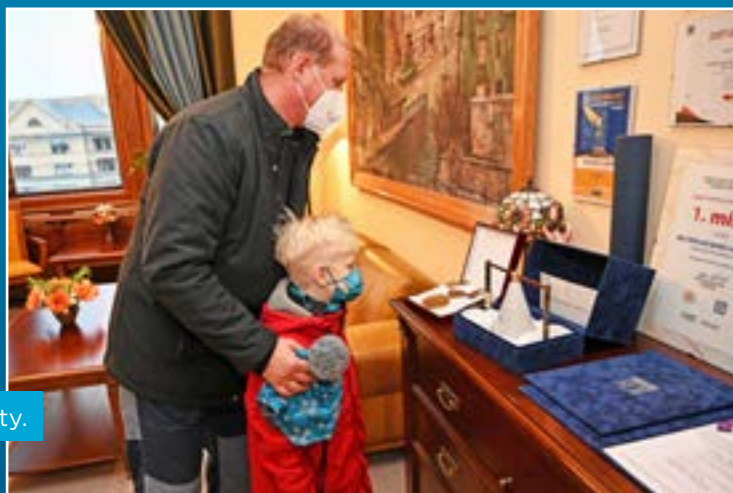
V kanceláři starosty.