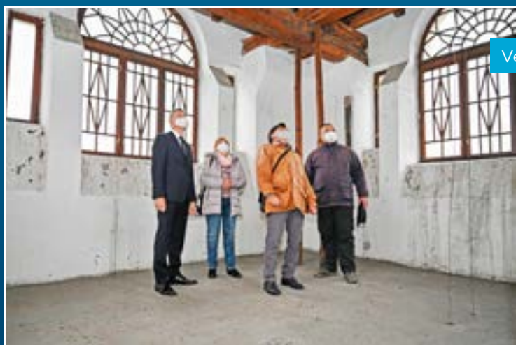
Ve věži slezskoostravské radnice.