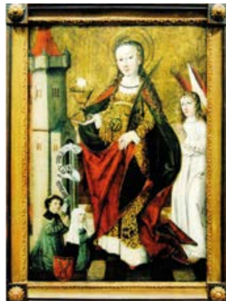
Obraz sv. Barbory z roku 1500

Majitel, hrabě Wilczek, se o kostel nezajímal a jeho stav se v průběhu následujících let nadále zhoršoval. V roce 1808 byla stavba blízko zániku. Vizitátor v tomto roce konstatoval, že uvnitř je oltář sv. Maří Magdaleny, který není ještě pozlacený, boční oltář sv. Floriana je ve špatném stavu, ve věži jsou dva malé zvony, ale nápisy na nich se nedaly přečíst pro značné nebezpečí, které hrozilo při vstupu do ztrouchnivělé věže. Uvnitř bylo šestnáct zchátralých lavic, kazatelna a dřevěný chór. Na oltáři byly dva mosazné svícny, které v roce 1685 věnoval Jiří Richter.